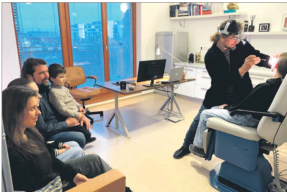
V ordinaci v Boettingerově ulici v Plzni

□ Jak se to vezme. V privátu jsem se mohl hlouběji věnovat spánkové chirurgii a výzkumu mini-invazivních metod léčby spánkové apnoe. Otevřel jsem vlastní spánkovou laboratoř. V tomto mi hodně pomohla spolupráce s americkými a evropskými pracovišti. Tehdy jsem byl horlivý a nevynechal snad jediný mezinárodní kongres, hodně jsem se učil a hodně přednášel. S přibývajícím lety již toto pole přenechávám mladším a spíše se snažím svoji energii směřovat do