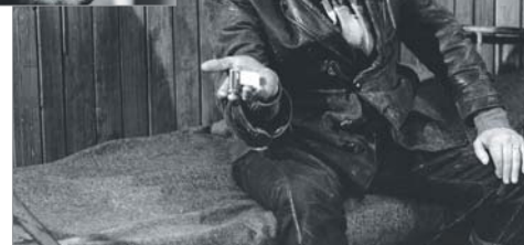
Herec Zdeněk Kryzánek