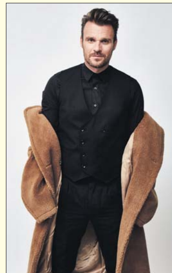
Leoš Mareš a jeho nezapomenutelné kožichy

Nedávno navíc upoutal pozornost široké veřejnosti nový televizní dokument, který poodhalil základy jeho života a ukázal ho nejen jako suverénního profíka, ale i jako