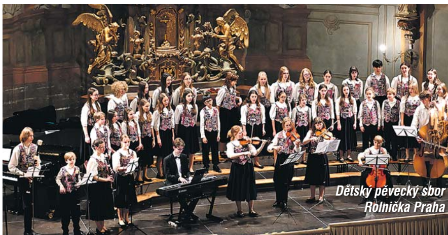
Dětský pěvecký sbor Rolnička Praha

Díky tomuto zájmu mohli organizátoři festivalu, klatovský spolek Kolegium pro duchovní hudbu, připravit pro festivalové publikum bohatý hudební program i v letošním roce. Festival letos nabídne čtyřadvacet koncertních a liturgických vystoupení, během nichž si budeme moci vyslechnout patnáct pěveckých těles a hudebních uskupení. Krom českých sborů bude