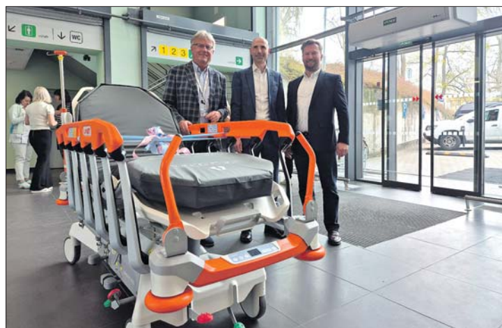
Nemocnice Strakonice převzala transportní lůžko jako poděkování za ocenění

„Zařízení nabízí elektrické polohování, integrované váhy nebo bezpečnostní prvky upozorňující na opuštění lůžka. Díky konstrukci navíc umožňuje převoz pacienta bez nutnosti