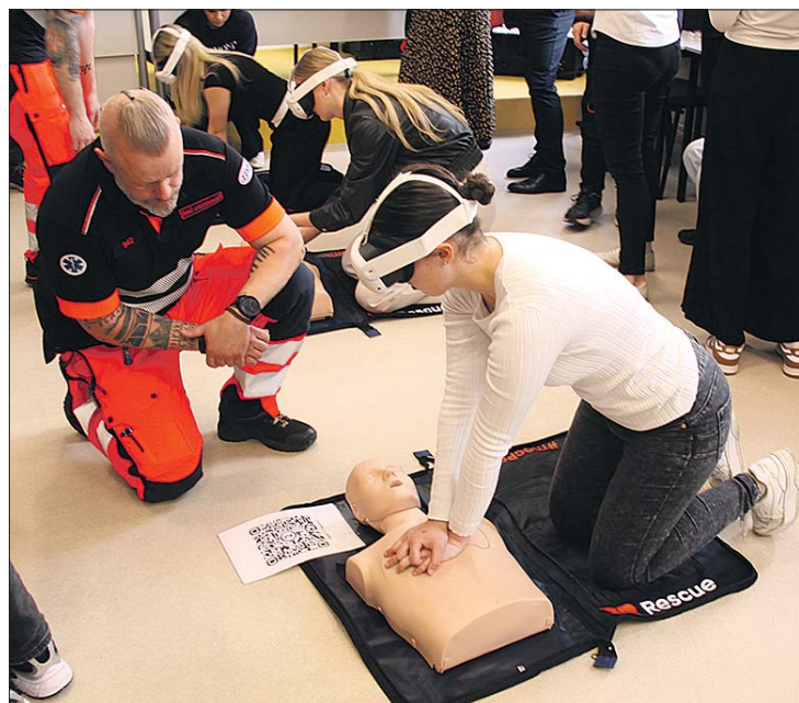
Studenti si vyzkoušeli simulovanou situaci, kdy je nutné provést resuscitaci.