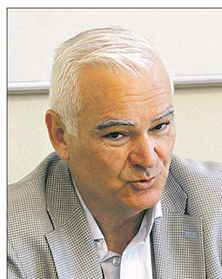
Hejtmán Plzeňského kraje Kamal Farhan

kteří jsou propojené s figurínou prostřednictvím umělé inteligence. Měli tak možnost si vyzkoušet simulovanou situaci, kdy je nutné provést resuscitaci – první pomoc tak, jak by měla skutečně probíhat. Školili záchranáři Zdravotnické záchranné služby Plzeňského kraje.