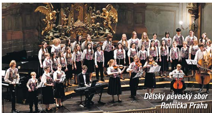
Dětský pěvecký sbor Rolnička Praha

Festival si během svého trvání dokázal v regionu vytvořit pevnou komunitu svých příznivců, sestávající krom publika na obou stranách hranice zejména z jednotlivých téměř „domácích“ sborů, které na festival opakovaně dojíždějí, a také z jednotlivých pořadatelských lokalit a jejich samosprávných i církevních institucí. V neposlední řadě s myšlenkou